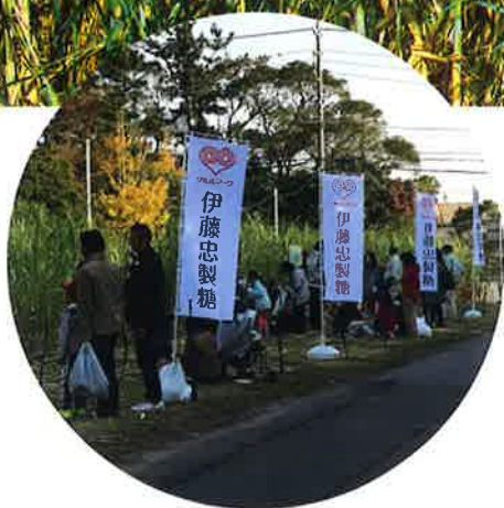
↑ 昨年の収穫体験の様子